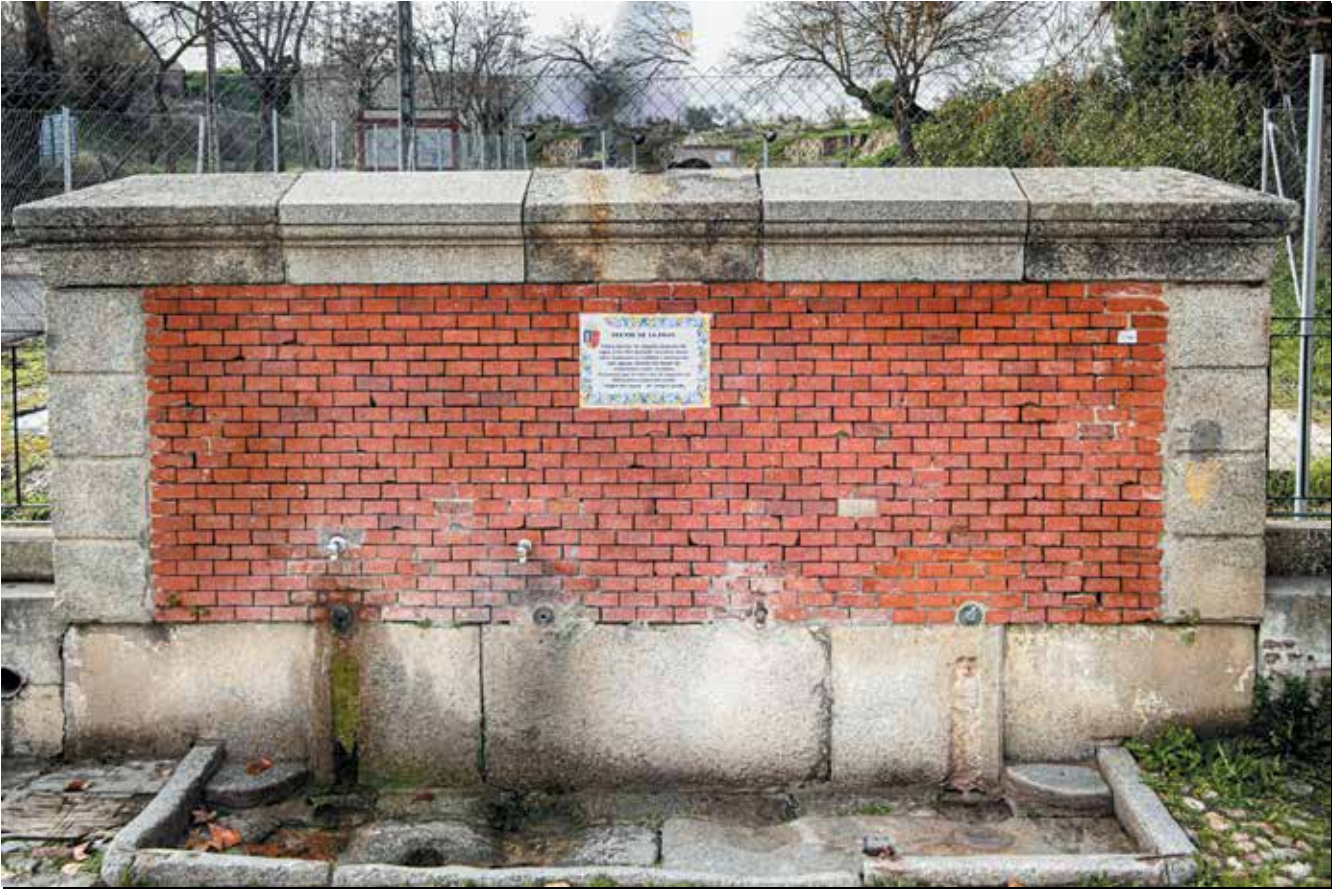
Imagen: Fuente de La Poza.